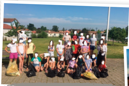
Action ramassage des déchets par des CM1 et CM2 de l'école Astrolabe - 27 juin