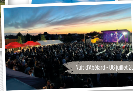
Nuit d'Abélard - 06 juillet 2024