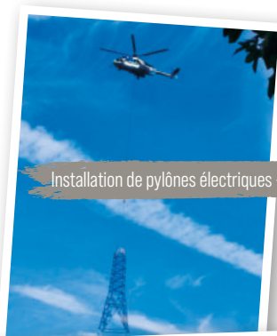
Installation de pylônes électriques - juillet 2024